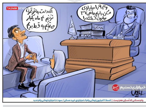
وام مستکنی که مستکن هم نیست!!!