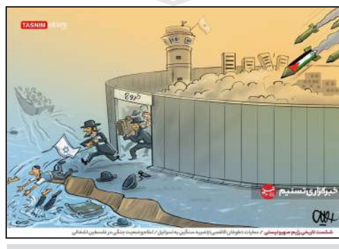
عملیات «طوفان الاقصی» ضربه سنگین به اسرائیل