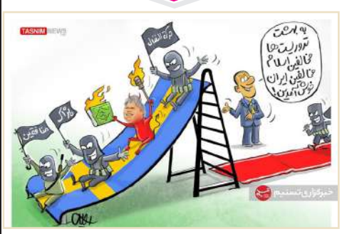
کاریکاتور/ «سوند» پیش‌ت تروریست‌ها در شمال اروپا