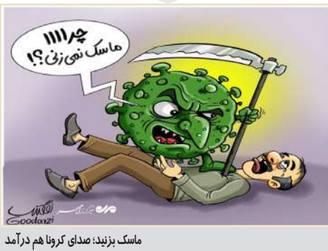
ماسک بزیند؛ صدای کرونا هم درآمد