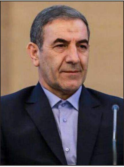
پنجشنبه تصمیم گیری می شود؛